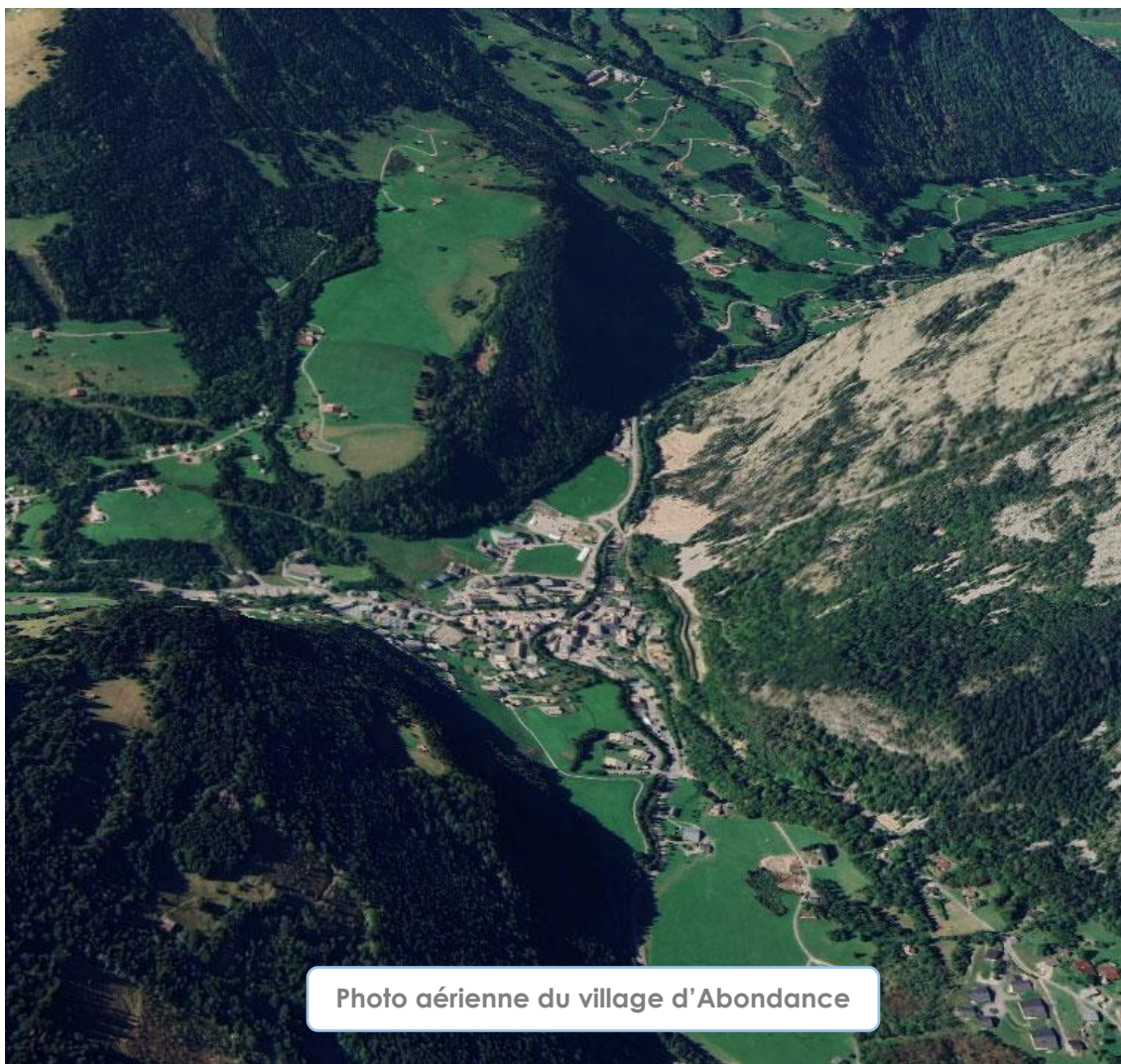
Photo aérienne du village d'Abondance